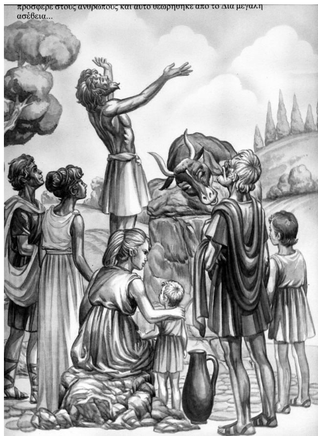
προσφερε στους ανθρώπους και αυτο θεωρηθηκε απο το Δια μεγαλη ασέβεια...

Οι Ολυμπιακοί αγώνες ήταν μέρος θρησκευτικής γιορτής που ήταν αφιερωμένη στο Δία, το βασιλιά των θεών. Γίνονταν κάθε τέσσερα χρόνια και συγκεντρώνονταν στην Ολυμπία άνθρωποι από όλη την Ελλάδα για να συμμετέχουν ή να παρακολουθήσουν του αγώνες.